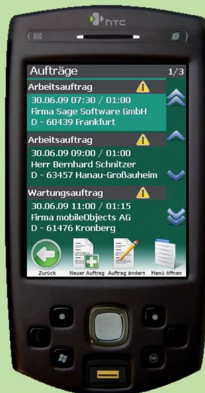
Endgerät für mobilen Kundenservice HTC P6500

Das Zusatzmodul mO – mobiler Kundenservice ermöglicht Ihnen und Ihren Mitarbeitern mit Hilfe spezieller Handys auch unterwegs auf Stammdaten und Aufträge im HWP zuzugreifen. Die Mitarbeiter können optimal gesteuert werden und sich per Navigationssoftware zum Kunden leiten lassen. Arbeiten lassen sich vor Ort dokumentieren, vom Kunden abzeichnen und per Knopfdruck an die Zentrale weiter leiten zwecks Rechnungsstellung.