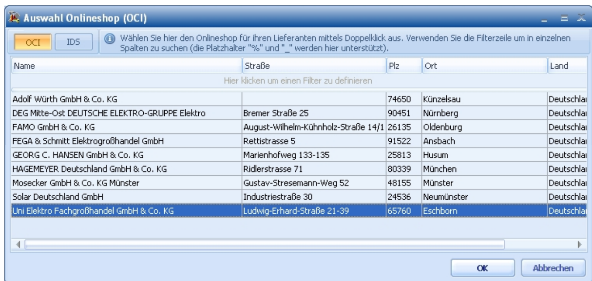
Abbildung: Auswahl der Großhandelswebshops über die OCI Schnittstelle

Unter funktionalen Gesichtspunkten unterscheiden sich die OCI und die IDS Schnittstelle wenig. In beiden Fällen öffnen Sie direkt aus dem Angebot heraus den Online Webshop des von Ihnen gewählten Großhändlers. Dort stellen Sie Ihren persönlichen Warenkorb zusammen, bestellen die Waren und übernehmen den Warenkorb in Ihr Angebot. Zur Kalkulation wird automatisch der aktuelle Einkaufspreis verwendet.