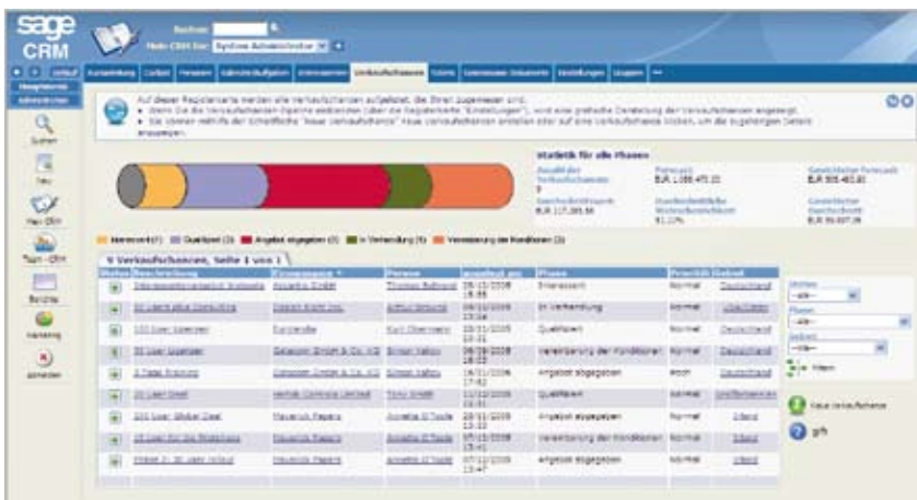
Analysieren und managen Sie Ihre Vertriebspipeline.